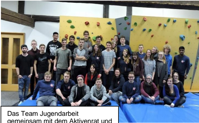
Das Team Jugendarbeit gemeinsam mit dem Aktivenrat und dem Jugendgemeinderat

Das Inkrafttreten des §41a der Gemeindeordnung besagt, dass Jugendliche bei Planungen und Vorhaben, die ihr Interesse berühren, in angemessener Weise beteiligt werden müssen.